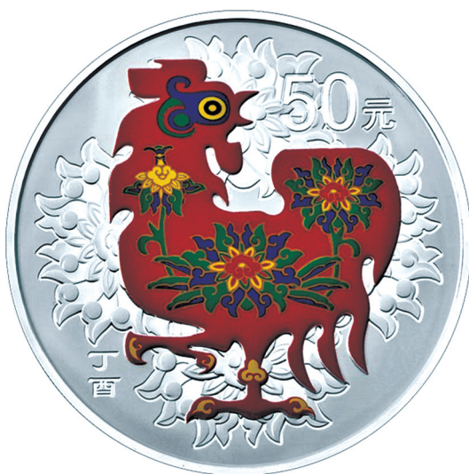
150克圆形精制银质彩色纪念币正面图案