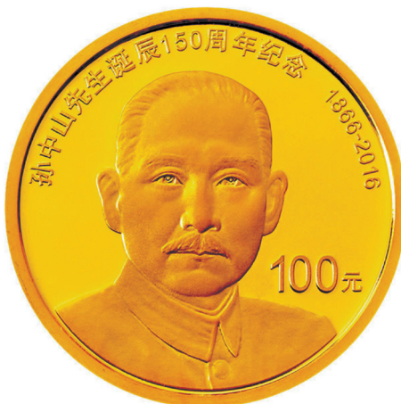
8克圆形精制金质纪念币正面图案