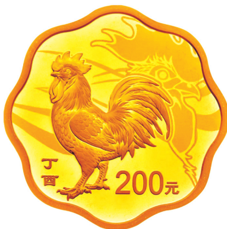
15克梅花形精制金质纪念币正面图案