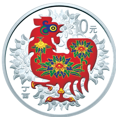
30克圆形精制银质彩色纪念币正面图案