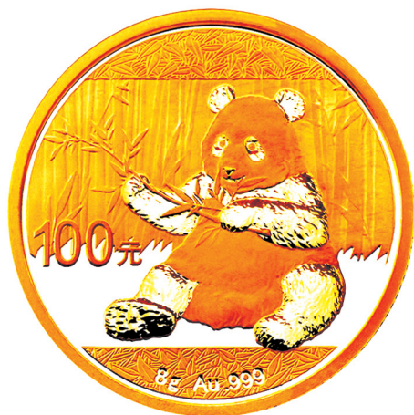
8克圆形普制金质纪念币正面图案