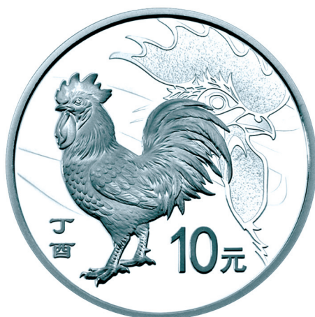
30克圆形精制银质纪念币正面图案