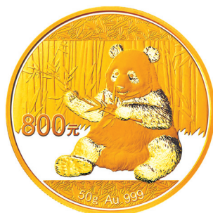
50克圆形精制金质纪念币正面图案