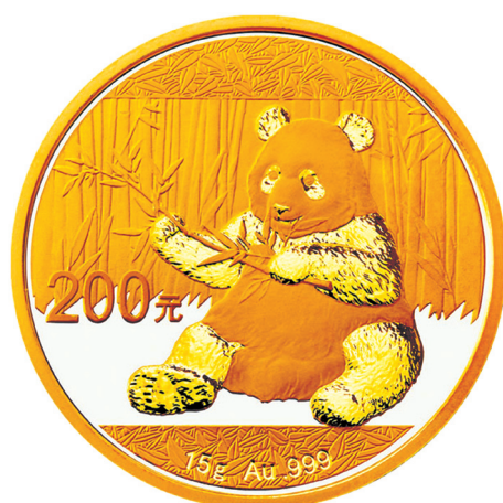
15克圆形普制金质纪念币正面图案