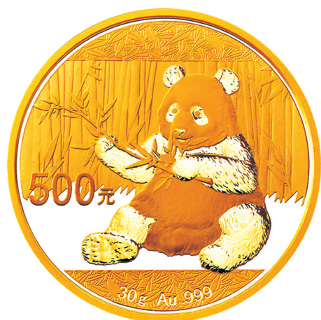
30克圆形普制金质纪念币正面图案