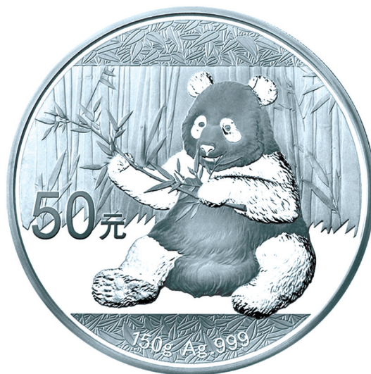
150克圆形精制银质纪念币正面图案