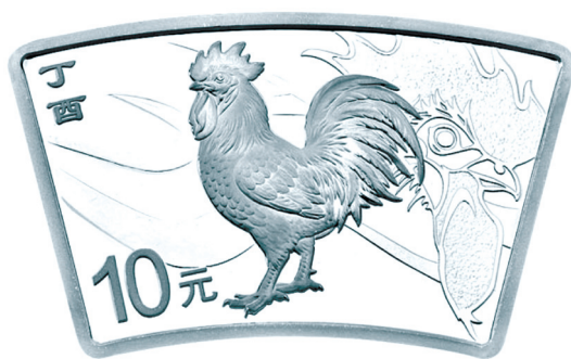
30克扇形精制银质纪念币正面图案