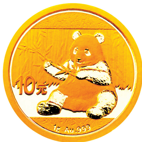
1克圆形普制金质纪念币正面图案