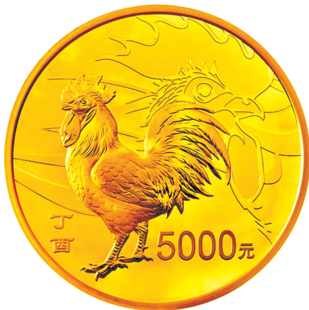
500克圆形精制金质纪念币正面图案