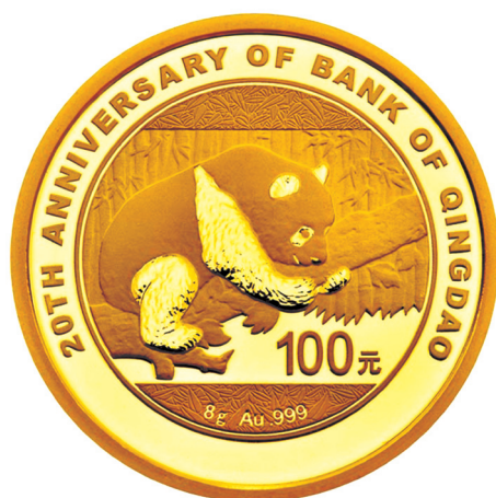
8克圆形普制金质纪念币正面图案