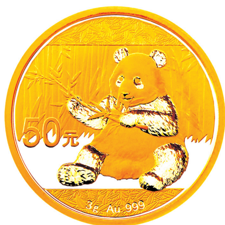
3克圆形普制金质纪念币正面图案