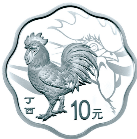
30克梅花形精制银质纪念币正面图案