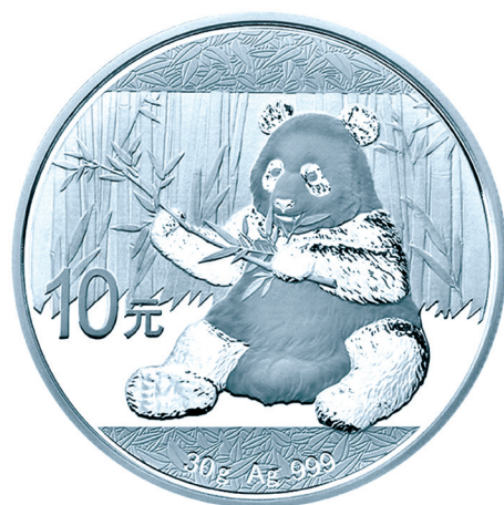
30克圆形普制银质纪念币正面图案