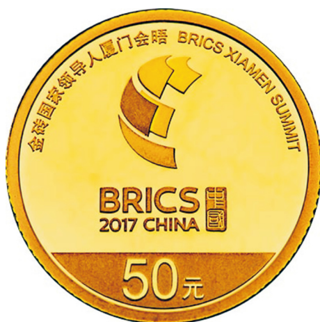
3克圆形精制金质纪念币正面图案