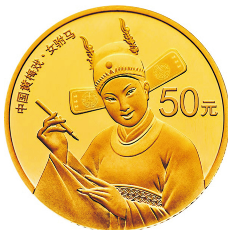
3克圆形精制金质纪念币正面图案