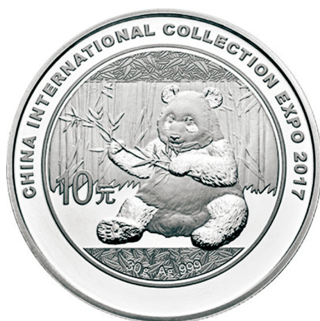
30克圆形普制银质纪念币正面图案