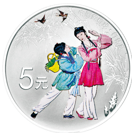
15克圆形精制银质彩色纪念币正面图案