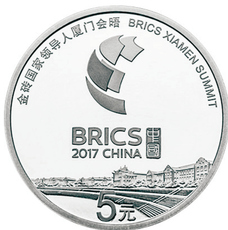
15克圆形精制银质纪念币正面图案