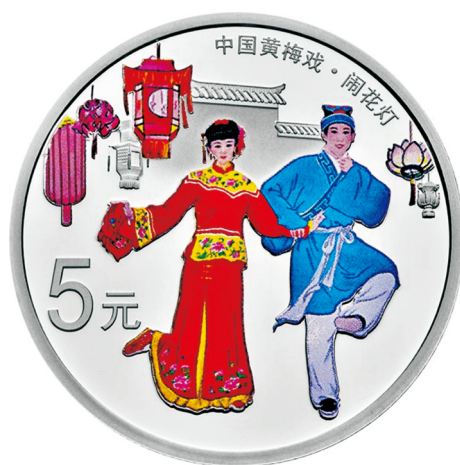
15克圆形精制银质彩色纪念币正面图案