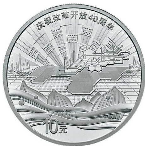
30克圆形精制银质纪念币正面图案