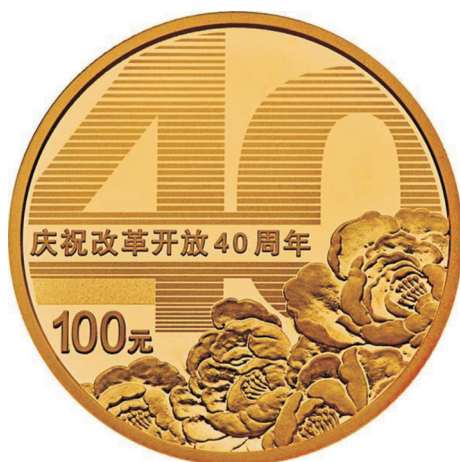
8克圆形精制金质纪念币正面图案