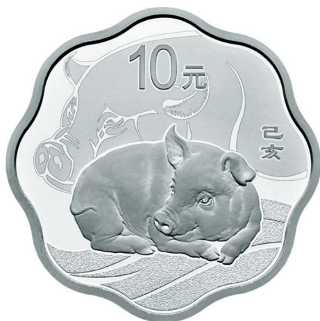
30克梅花形精制银质纪念币正面图案