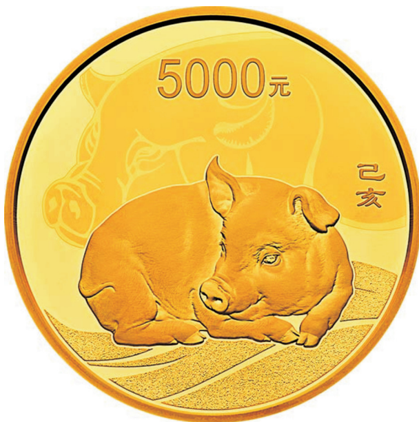
500克圆形精制金质纪念币正面图案