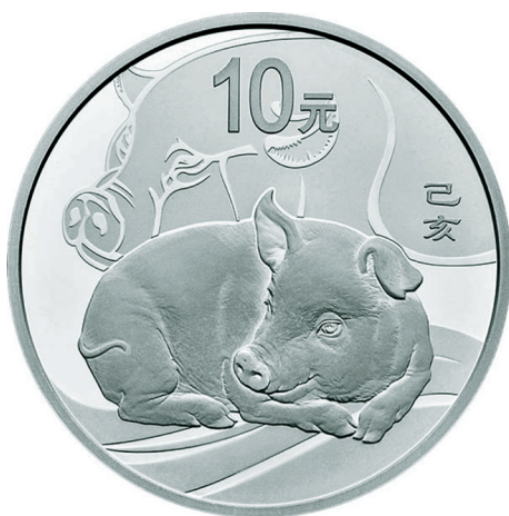
30克圆形精制银质纪念币正面图案