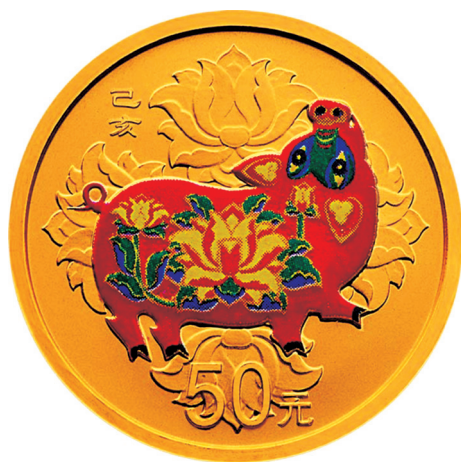
3克圆形精制金质彩色纪念币正面图案