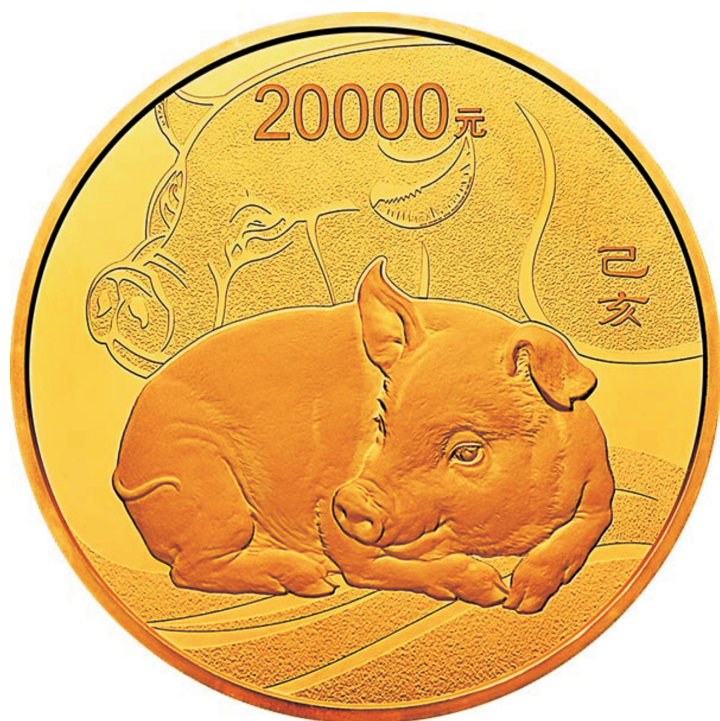
原大 2公斤圆形精制金质纪念币背面图案