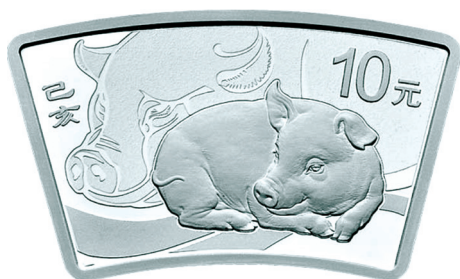
30克扇形精制银质纪念币正面图案