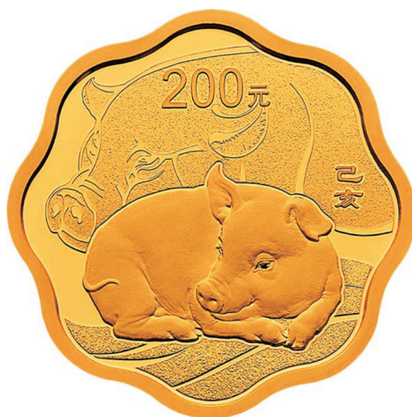
15克梅花形精制金质纪念币正面图案