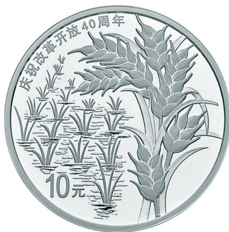
30克圆形精制银质纪念币正面图案