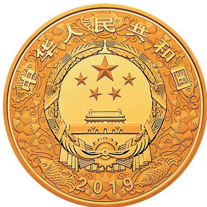
原大 2公斤圆形精制金质纪念币正面图案