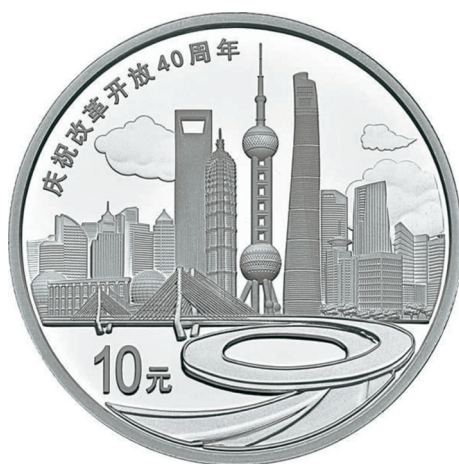
30克圆形精制银质纪念币正面图案