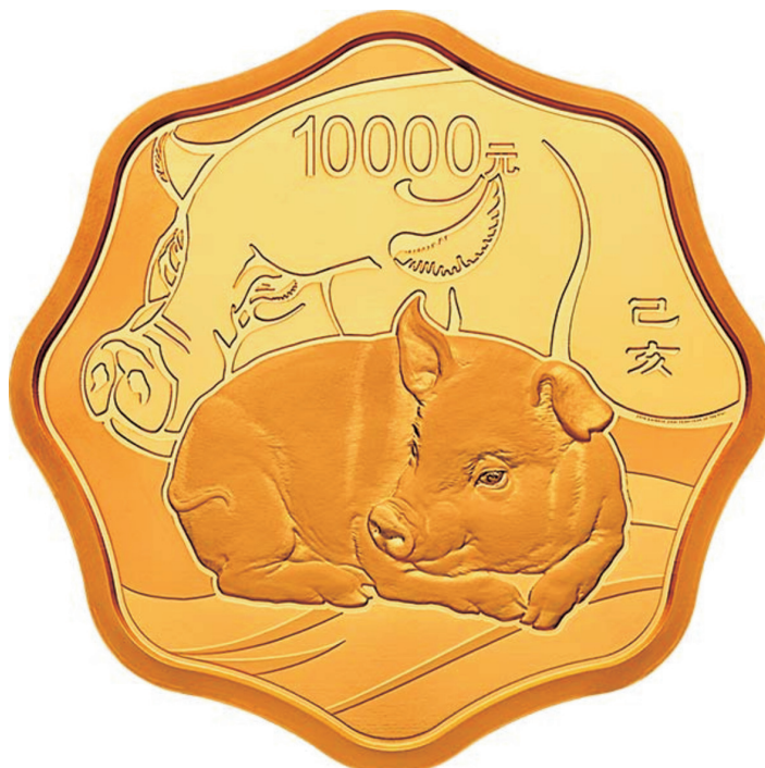
1公斤梅花形精制金质纪念币正面图案