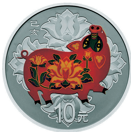
30克圆形精制银质彩色纪念币正面图案