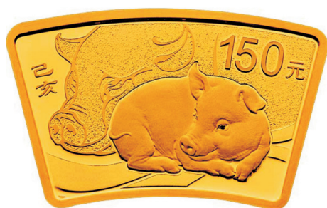
10克扇形精制金质纪念币正面图案