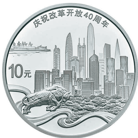
30克圆形精制银质纪念币正面图案