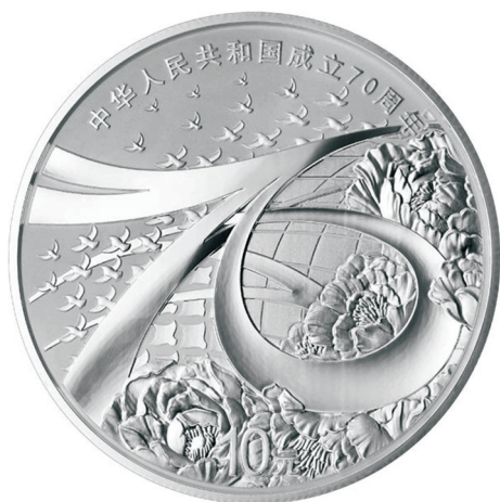
30克圆形精制银质纪念币正面图案