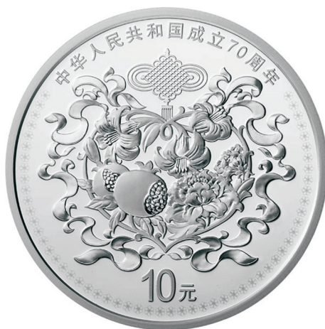
30克圆形精制银质纪念币正面图案