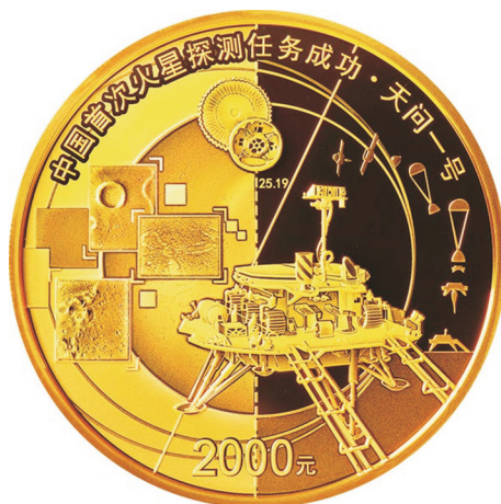
150克圆形精制金质纪念币正面图案