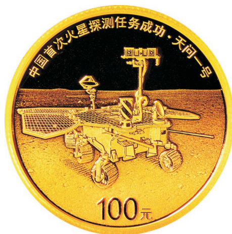
8克圆形精制金质纪念币正面图案