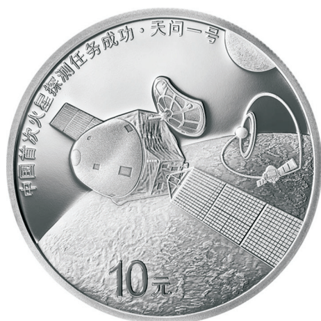
30克圆形精制银质纪念币正面图案