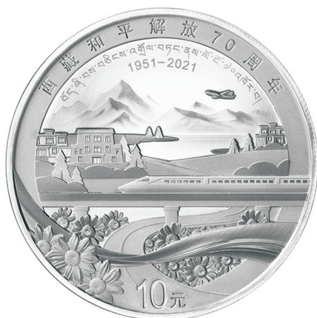
30克圆形精制银质纪念币正面图案