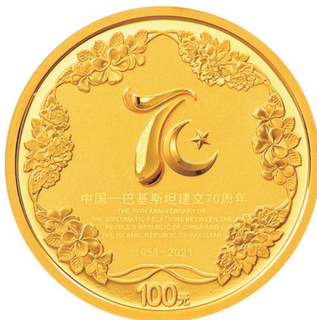
8克圆形精制金质纪念币正面图案