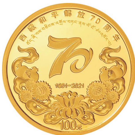
8克圆形精制金质纪念币正面图案