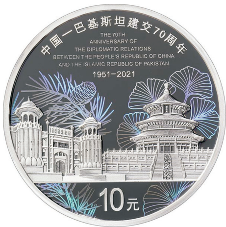
30克圆形精制银质纪念币正面图案