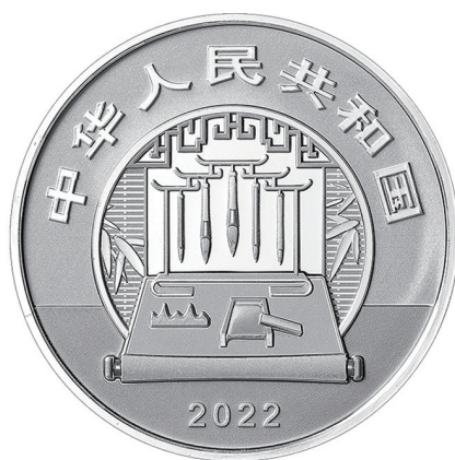
60克圆形精制银质纪念币正面图案