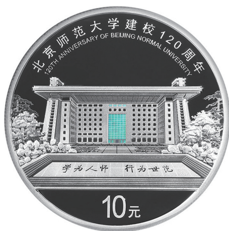
30克圆形精制银质纪念币背面图案