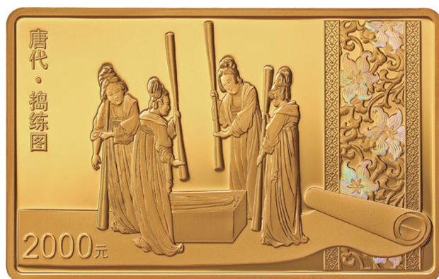
150克长方形精制金质纪念币背面图案