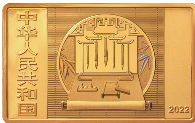
150克长方形精制金质纪念币正面图案