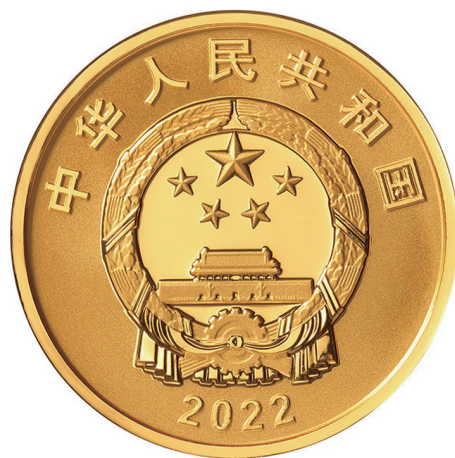
8克圆形精制金质纪念币正面图案