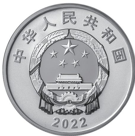
30克圆形精制银质纪念币正面图案