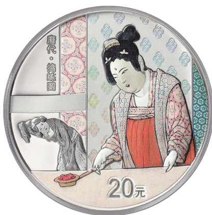
60克圆形精制银质纪念币背面图案