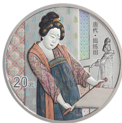
60克圆形精制银质纪念币背面图案