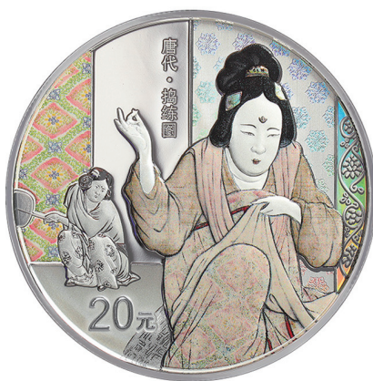
60克圆形精制银质纪念币背面图案